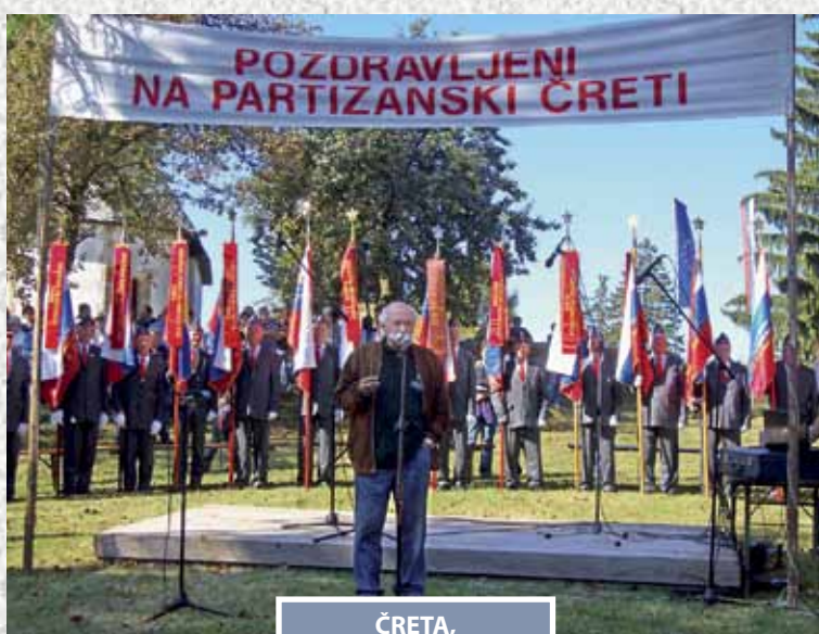
ČRETA, 1. oktober 2011