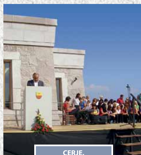
CERJE, 17. september 2011