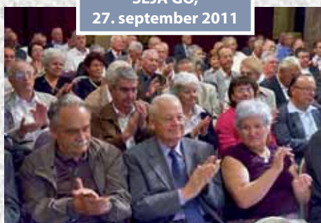
SEJA GO, 27. september 2011