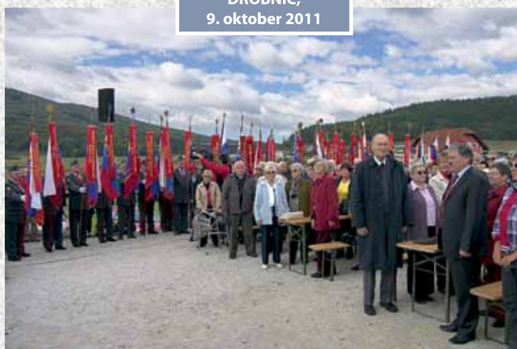
DROBNIČ, 9. oktober 2011